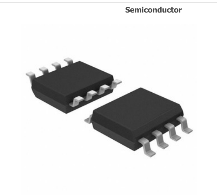
Obraz może być reprezentacją. Zobacz specyfikację dla szczegółów produktu.